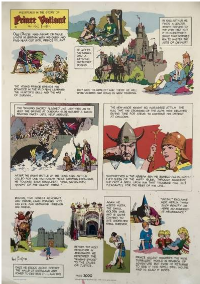
Abb.6: Sonderdruck Seite 2.000