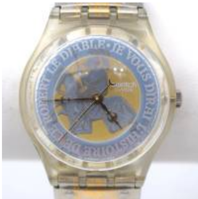
Abb.2: Swatch Uhr