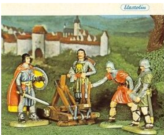
Abb.11: Prinz Eisenherz und Gawain aus einem Hausser Elastolin-Katalog