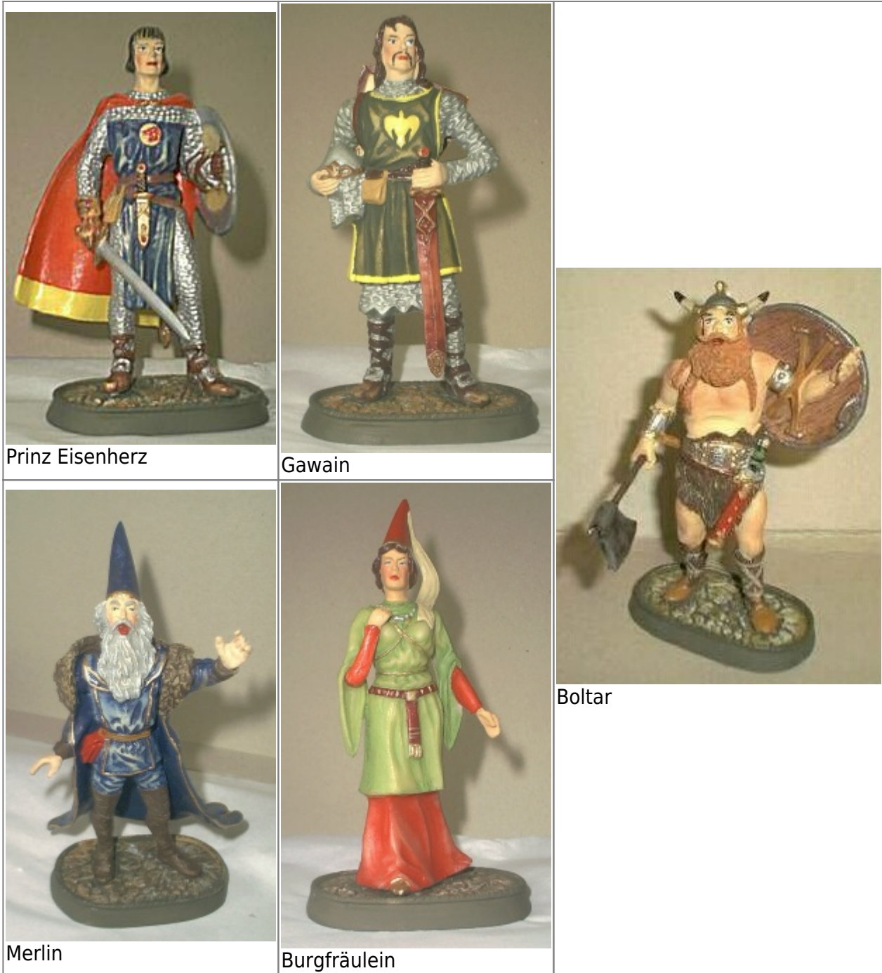
Abb.13: fünf Figuren einer von Bulls, Kings Features Syndicate, herausgegebenen Sonderserie. Jede Figur ist ca. 14 cm hoch und auf 120 Kopien limitiert. Zumindest die Eisenherz-Figur ist ein