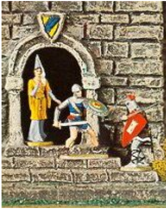
Abb.12: Prinz Eisenherz verteidigt ein Burgfräulein (aus einem Hausser Elastolin-Katalog)