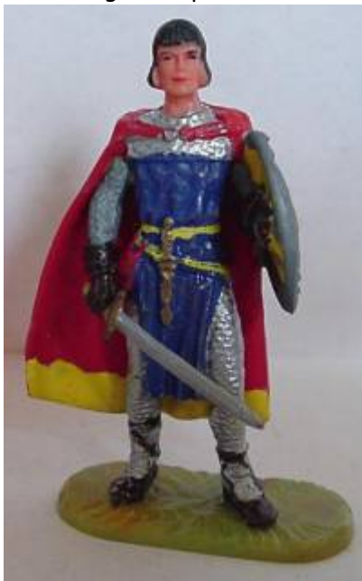
Abb.10: Prinz Eisenherz in Elastolin