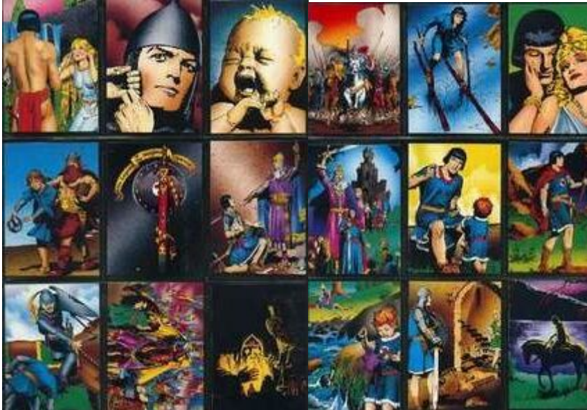
Abb.3: Sammelkarten (Auszug)