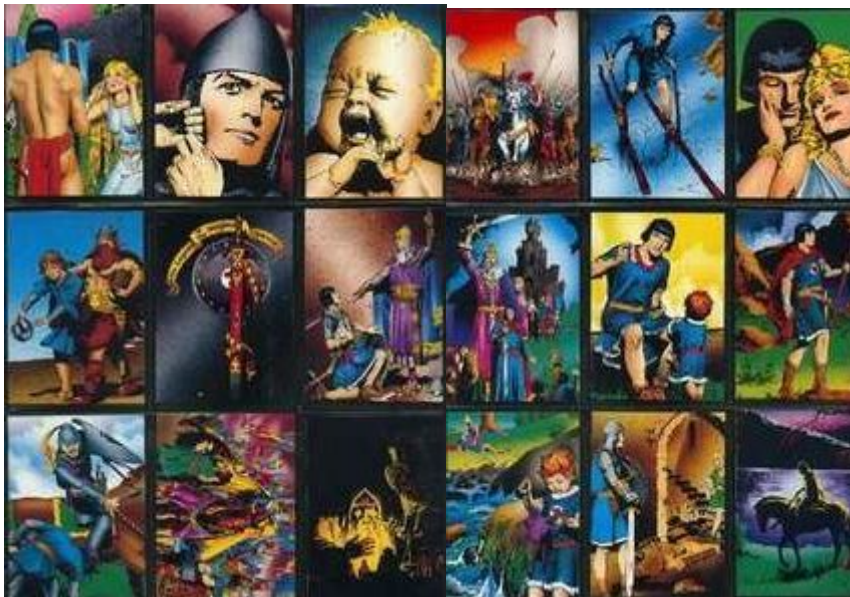
Abb.2: Sammelkarten (Auszug)