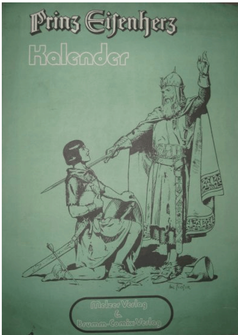
Abb.3: Kalender 1972

Dieser Kalender aus dem Hause Melzer ist nie regulär verkauft worden. Er zeigt den Kampf den jungen Eisenherz gegen den roten Ritter .