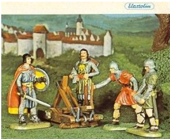
Abb. 5: Prinz Eisenherz und Gawain aus einem Hausser Elastolin-Katalog