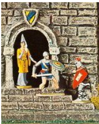
Abb. 6: Prinz Eisenherz verteidigt ein Burgfräulein (aus einem Hausser Elastolin-Katalog)