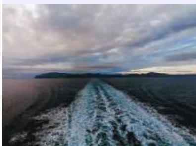
Bild 2: Die Insel Amorgos wie man sie von der Fähre aus sieht, Blickrichtung aus Nordwest nach Südost.