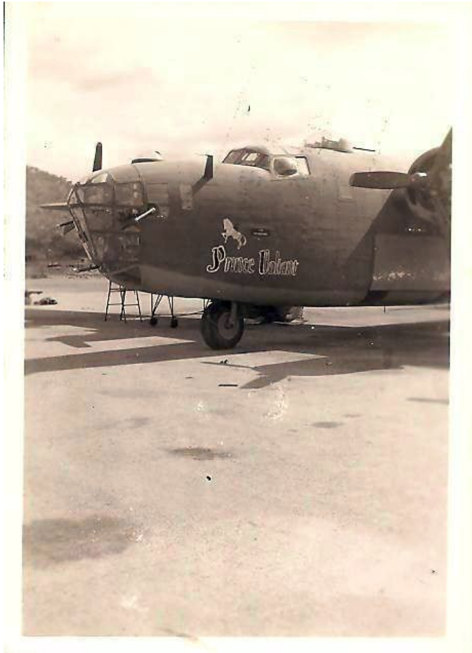
1944 KING FEATURES Prinz Valiant Syroco Figur (USA)

Die Homepage 380th.org listet alle Flugzeuge des Geschwaders auf - und so fand ich diesen Link zu diesem Bomber - und dort dann folgendes Photo: